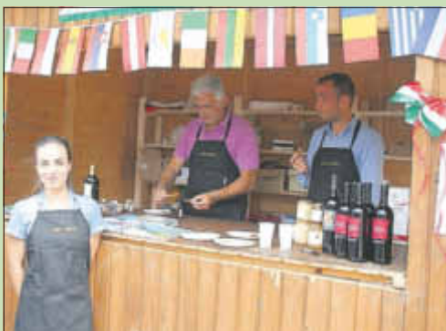
Magione am 10. Juli 2011