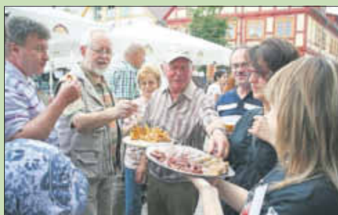
Suwalki am 9. Juli 2011