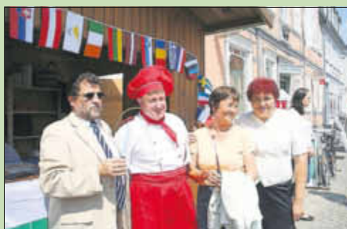
Gorna Oryahovitsa am 8. Juli 2011

Viele schöne Momente verdanken wir dem Gospelchor aus Suwalki. Mit seinen fantastischen Stimmen beeindruckte er gleich mehrfach das Warener Publikum. Auch eine Bildershow des bulgarischen Fotografen Kalin Christof berührte bei der Präsentation in der Stadtverwaltung.