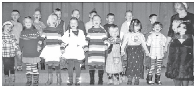
Kinder und Team der Kita Bummi

Allen Eltern und Großeltern eine besinnliche Weihnacht und ein gesundes Jahr 2011.