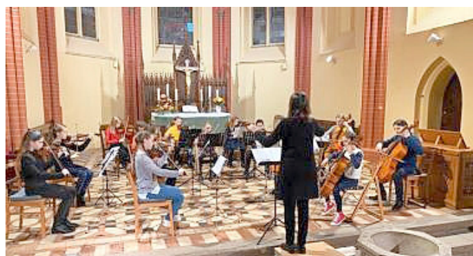
Die Junior Strings beim Wandelkonzert 2020 in der Georgenkirche

Ensembles und Solist*innen der Kreismusikschule Müritz und Organist*innen spielen wieder Wärme- und Licht-Musik für die kalte und dunkle Jahreszeit in St. Marien (17:00 Uhr), St. Georgen (17:45 Uhr) und Hl. Kreuz (18:30 Uhr).