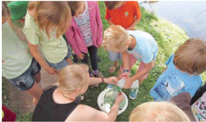
Was lebt wohl alles im Herrensee? Antworten gibt's beim Ferienaktionstag im Müritzeum

30.06./21.07./11.08. 10:00 - 12:00 Uhr Wer spinnt denn da? Das Spinnenleben am seidenen Faden 28.07./18.08. 10:00 - 12:00 Uhr Wer wohnt auf der Insektenwiese?