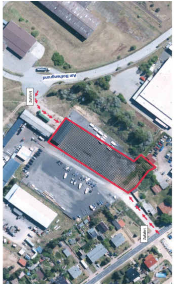
Lageplan: gewerbliche Fläche Am Rothengrund, ca. 3.700 m 2