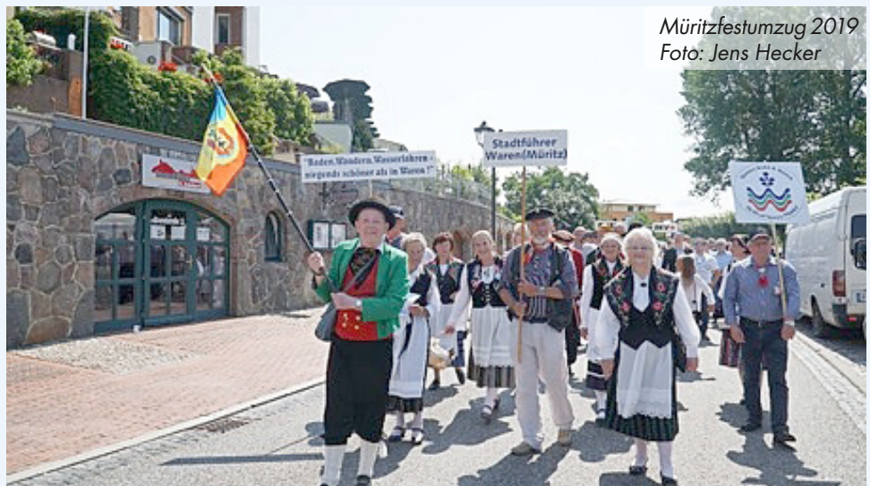
Müritzfestumzug 2019

Beide Themen möchten wir gern mit Ihnen in einem Gespräch klären.