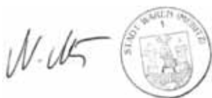
N. Möller Bürgermeister

In der erneuten Bürgerinformation wird der geänderte Entwurf des Bebauungsplanes vorgestellt, der eine zweigeschossige Wohnbebauung vorsieht.