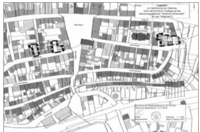
N. Möller Bürgermeister Stadt Waren (Müritz)