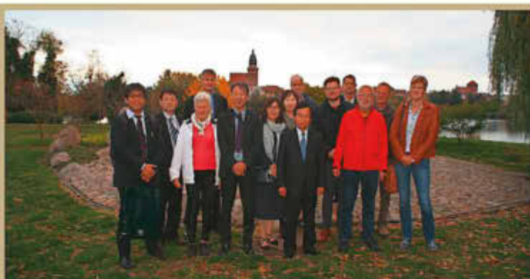
Bürgermeister Mamoru Toda (Mitte) mit einer Delegation aus der Partnerstadt Rokkasho am Zen-Stein-Garten „Kranich von Waren“