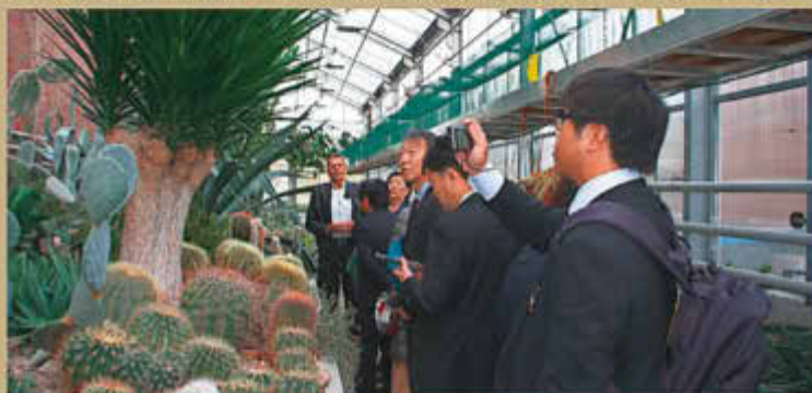
Besichtigung der Gewächshäuser im Schaugarten der Lebenshilfswerk Waren gGmbH am Tiefwareensee im Oktober 2019