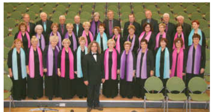
Ein Foto des Chores aus früheren Zeiten