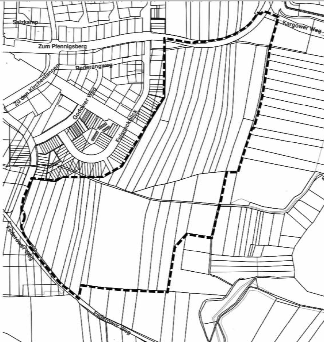
Ersatzmaßnahme Ausgleich Anlage einer Feldhecke: Gemarkung Warenschhof, Flur 4, Flurstück 21