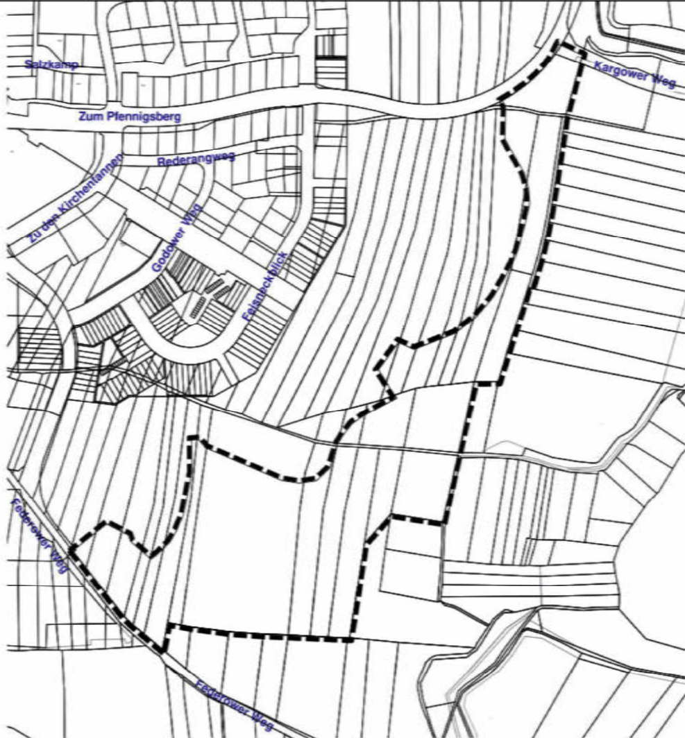
Ausgleichsmaßnahme von Extensivacker: Gemarkung Waren, Flur 39, Flurstück 51/8