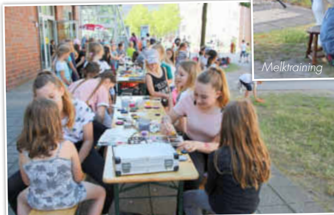
Kinderschminken mit dem CJD