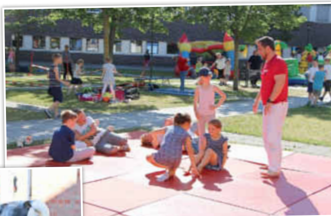
Auf der Suche nach Talenten - angehende Judokas?