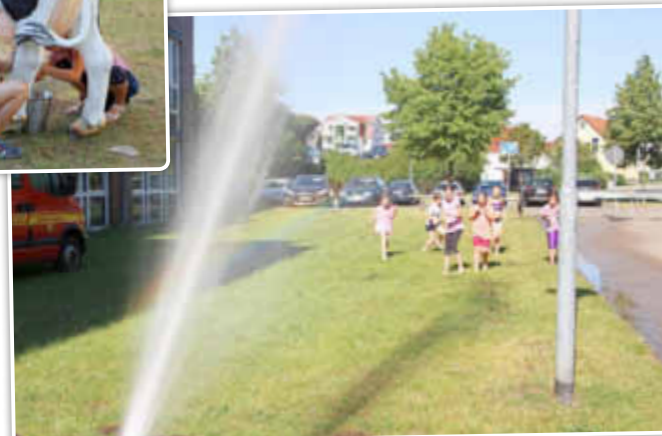
Wasserspiele der Warener Feuerwehr

Amtliches Mitteilungsblatt der Stadt Waren (Müritz) mit Ortsteilen