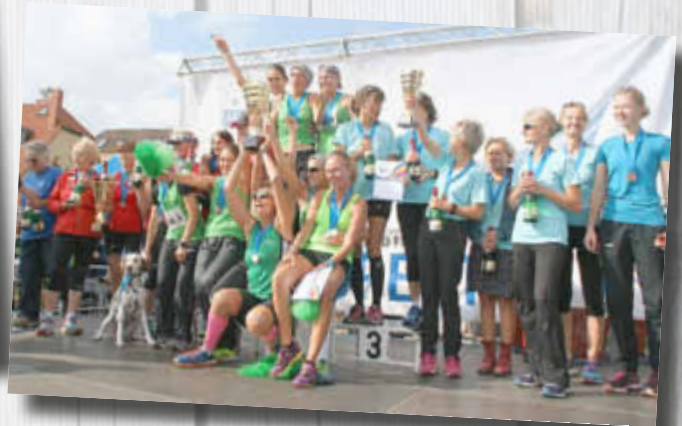
Siegerehrung Staffellauf Frauen