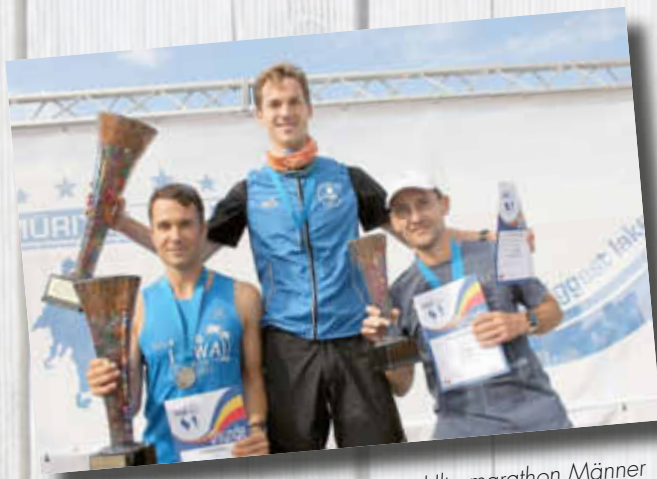
Sieger Ultramarathon Männer

Den Staffellauf rund um die Müritz gewannen bei den Frauen „Die Laufbekanntschaften“ aus Berlin, vor den Teams vom HSV Neubrandenburg und dem LAV Waren.