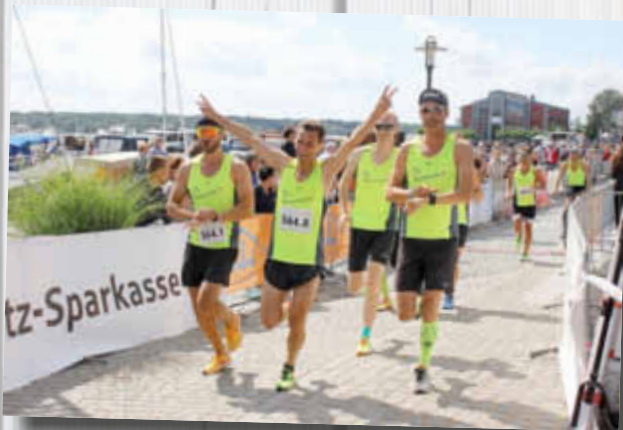
„Der Rest“ beim Zieleinlauf am Warener Stadthafen