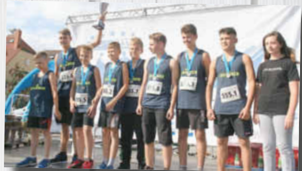
Ehrenpokal Laufteam der ESV-Boxer Jugend

Das Team der Warener Feuerwehr startet bereits eine Stunde früher. Sie liefen die 75 km in voller Ausrüstung und sammelten für den guten Zweck. Die Gelder gehen an die „Spezialisierte Ambulante Palliativversorgung für Kinder und Jugendliche in Mecklenburg-Vorpommern - an das Team Mike Möwenherz“. Neben vielen Sportlern, Betreuern und Gästen spendetet auch der ESV das Startgeld der Staffel in Höhen von 75 €.