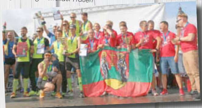
Siegerehrung Staffellauf Männer