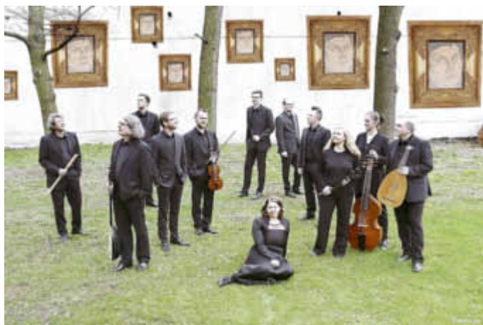
Calmus Ensemble und **lauten compagney BERLIN

Donnerstag, 31.08.2017, 19:30 Uhr in der Georgenkirche Waren