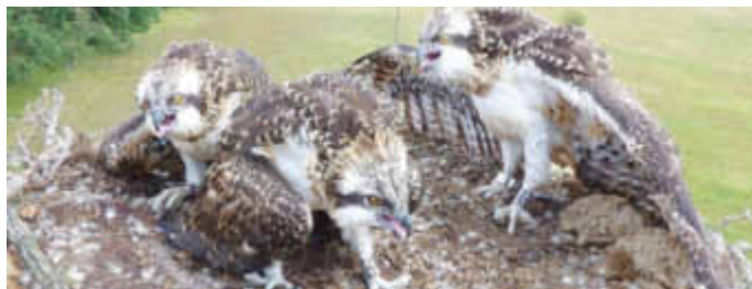
Bei Müritzhof zogen die Fischadler drei Junge groß. Das Bild entstand während der Beringung der Tiere durch fachkundige Helfer.