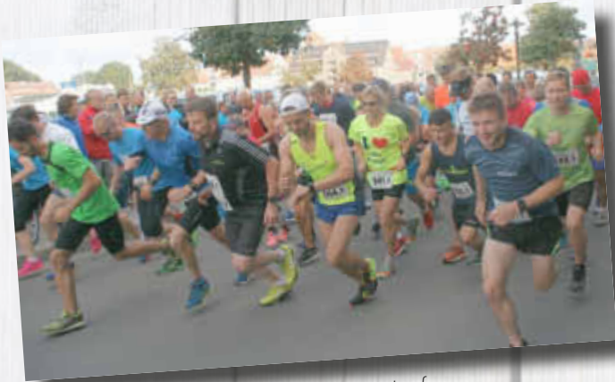
Start der Staffell-Teams zum 17. Müritz-Lauf