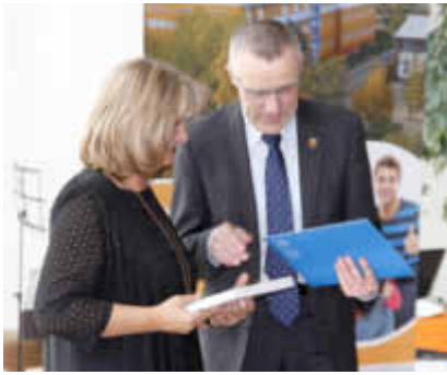
Schulleiterin und Bürgermeister