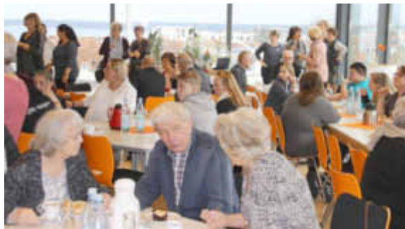
Treffen der Ehemaligen

Aus der Gratulation des Bürgermeisters: ... Mit viel Engagement ist es der Schulleitung, den Lehrerinnen und Lehrern und nicht zuletzt den Schülerinnen und Schülern gelungen, eine sehr gute Lernatmosphäre zu schaffen. Auch die Einrichtung eines Schülercafés, eines Kinosaales, der Aufbau eines wirklich außergewöhnlichen Multi-Media-Raumes mit Fahrstuhl und die Arbeit der Schulstation trugen maßgeblich zur Verbesserung der Lernbedingungen bei. Nicht vergessen werden soll hier das Schulgartenprojekt „Biotop“. Es wurde sogar 2012 mit dem 18. Umweltpreis der Stadt ausgezeichnet. Die Gestaltung der Außenfassade der Turnhalle war ein weiteres Projekt in Eigenleistung. Es integrierte Schülerinnen und Schüler sowohl im kreativen als auch handwerklichen Bereich. Jetzt steht die Umgestaltung des Pausenhofes auf der Wunschliste. Das Projekt weist in die Zukunft und ist Beleg für ein schöpferisches Miteinander. Im Namen der Stadt gratuliere ich herzlich zum Jubiläum und danke an dieser Stelle speziell der Schulleitung, den Lehrerinnen und Lehrern, den Mitarbeiterinnen und Mitarbeitern sowie allen ehemaligen Kolleginnen und Kollegen für die geleistete Arbeit mit den Kindern. Ich wünsche weiterhin Erfolge, vor allem aber Freude am Lehren. Allen jetzigen und zukünftigen Schülerinnen und Schülern wünsche ich gute Noten und natürlich auch Spaß am Lernen in der Regionalen Schule „Friedrich Dethloff“.