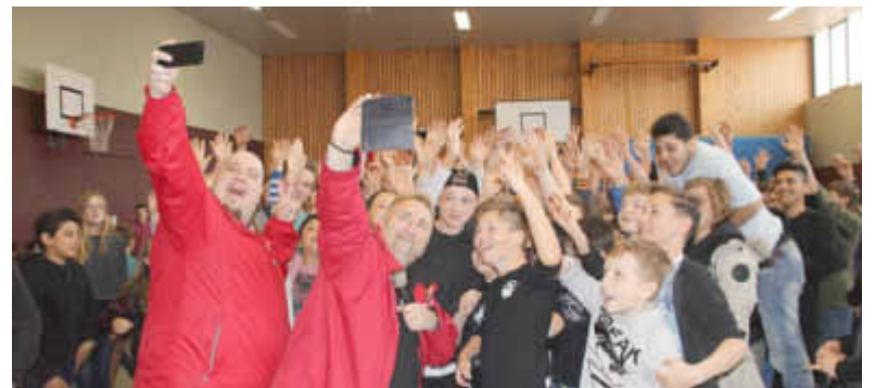
Superselfie mit den Superköchen!