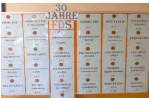
Aktionstage - 30 Stationen für die Schüler