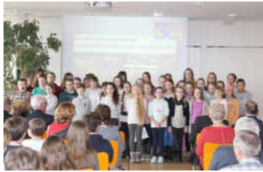
Schülerchor singt die Schulhymne