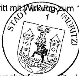
N. Möller Bürgermeister

Gemäß § 5 Abs. 5 der Kommunalverfassung für das Land Mecklenburg-Vorpommern (Kommunalverfassung - KV M-V) in der Fassung der Bekanntmachung vom 13. Juli 2011 (GVOBl. M-V 2011 S. 777), zuletzt geändert durch Artikel 1 des Gesetzes vom 23. Juli 2019 (GVOBl. M-V S. 467) kann ein Verstoß gegen Verfahrens- und Formvorschriften, die in der KV M-V enthalten oder aufgrund derselben erlassen worden sind, nach Ablauf eines Jahres seit der öffentlichen Bekanntmachung nicht mehr geltend gemacht werden. Diese Einschränkungen gelten nicht für die Verletzung von Anzeige-, Genehmigungs- und Bekanntmachungsvorschriften. Ein Verstoß ist schriftlich unter Bezeichnung der verletzten Vorschriften und der Tatsache, aus der sich der Verstoß ergeben soll, gegenüber der Stadt Waren (Müritz), Der Bürgermeister, Zum Amtsbrink 1, 17192 Waren (Müritz) geltend zu machen.